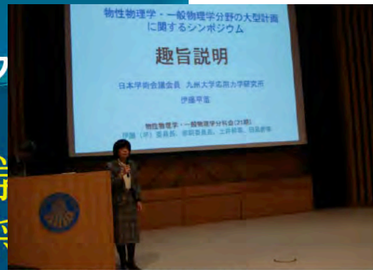
開会挨拶 (伊藤物一分科会委員長)

<主催> 日本学術会議 <参加> 事前登録不要 <問合せ先> 東京大学 04-7136-3201