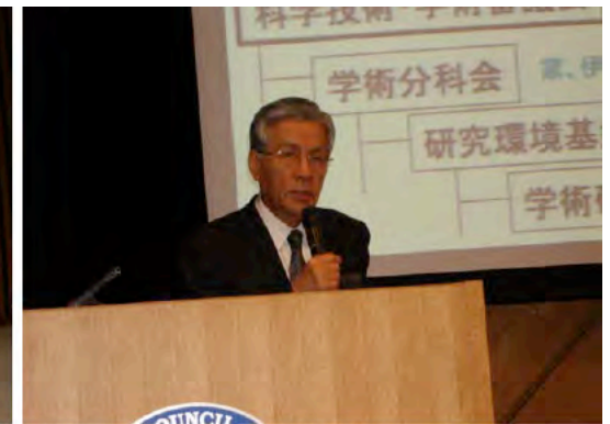
永宮物理学委員長