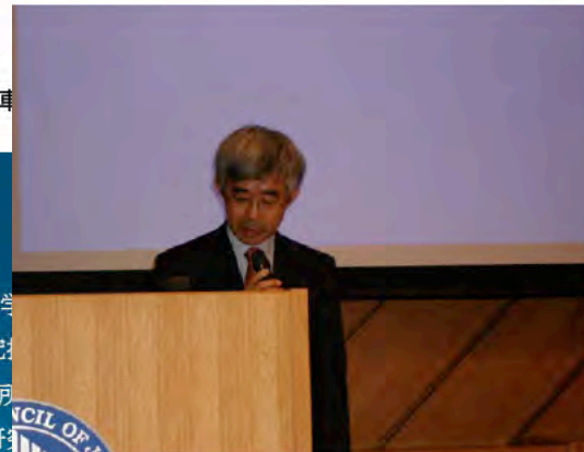
磯田研究振興局長